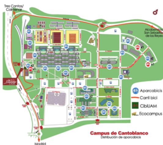
Fig 1, 2 and 3. CibiUAM (Centro Integral de la Bicicleta de la UAB): imágenes y localización.