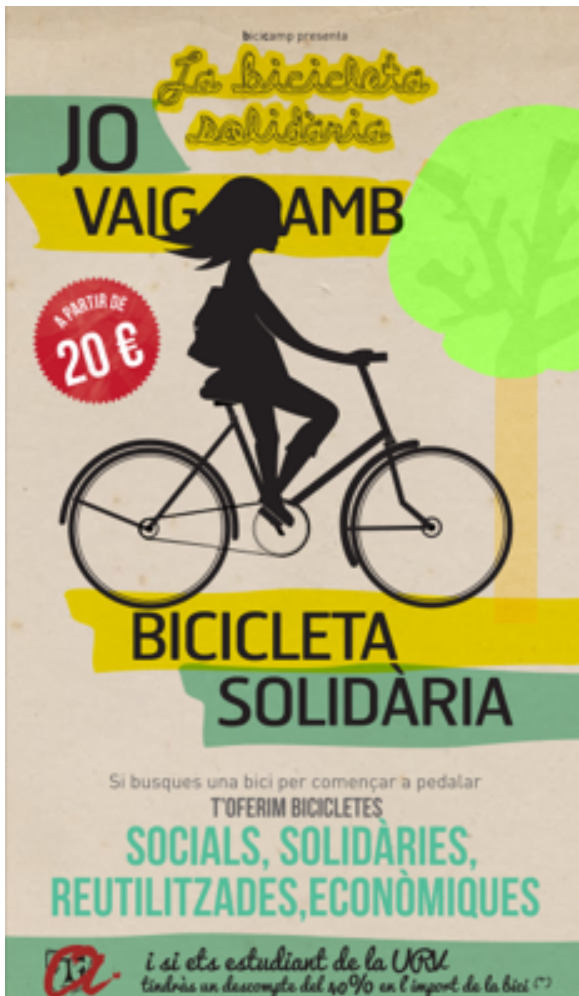
Fig 1. Poster de la campanya de difusió