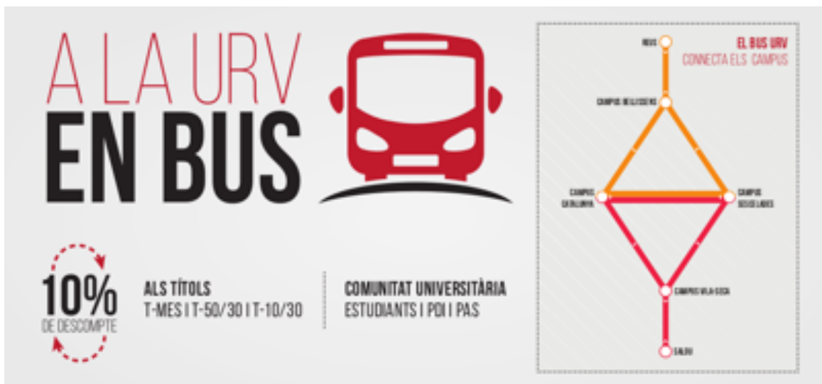
Fig 1. Discount promotion