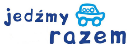
Fig. 2. El logotipo del sistema de uso compartido de vehículos en la Universidad Tecnológica de Cracovia.