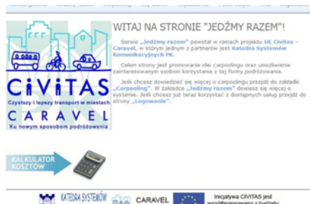
Fig. 1. La base de datos del uso compartido de vehículos.