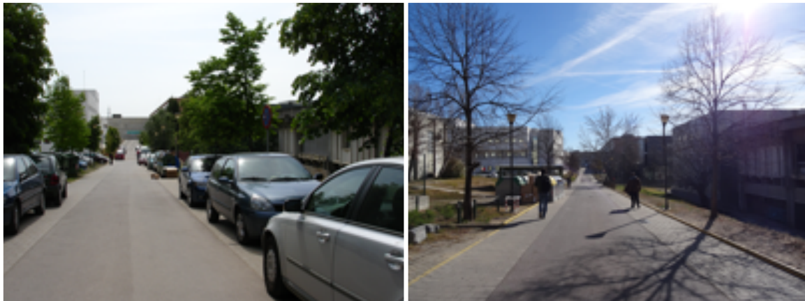
Fig. 1. Antes y después de la implementación del Proyecto.