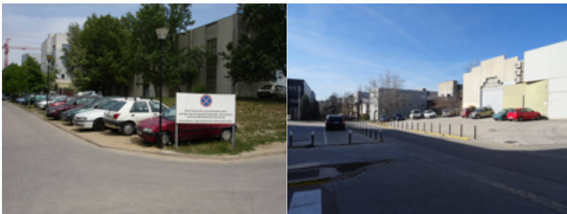
Fig.2. Antes y después de la implementación del proyecto.