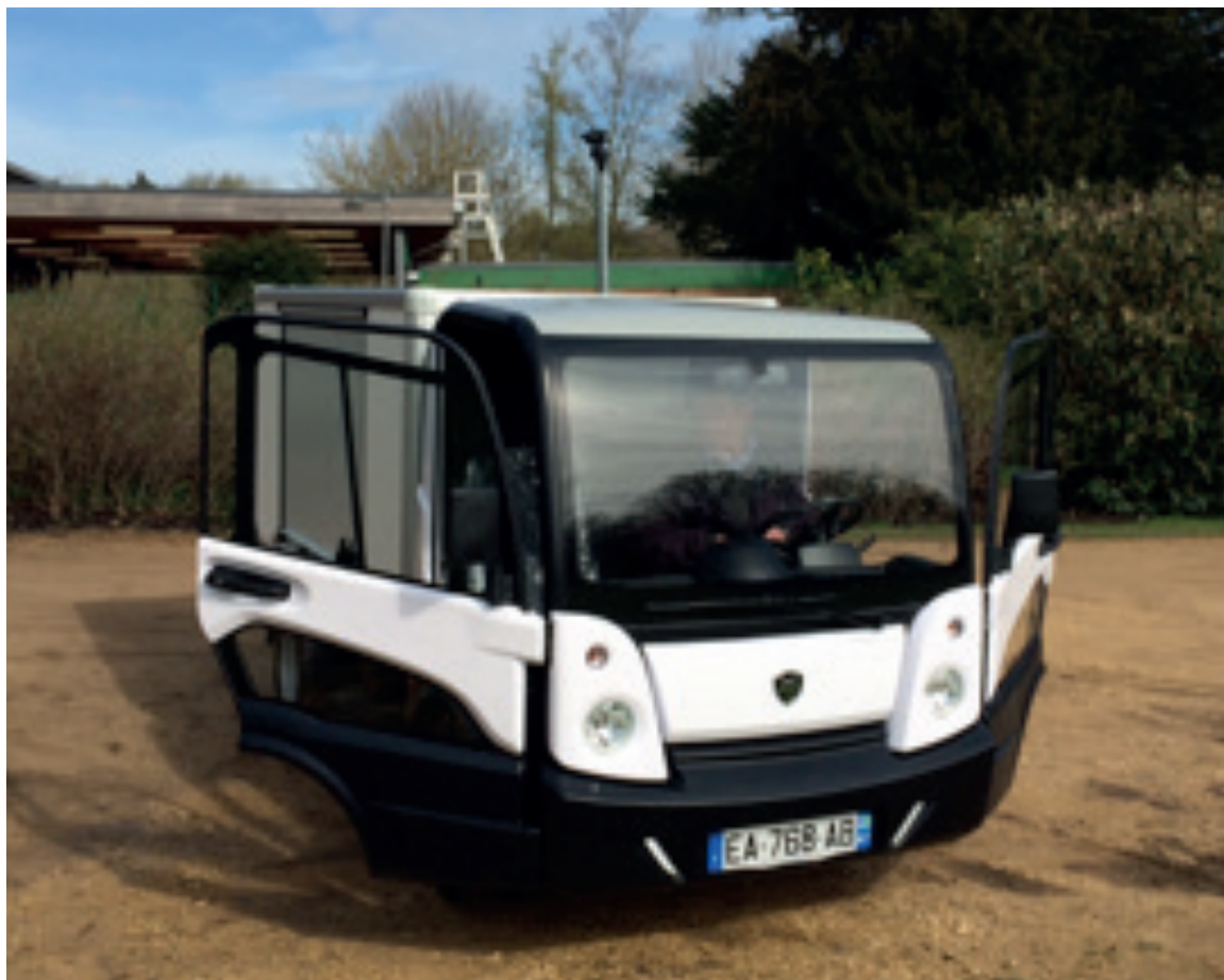
Fig 1. Volquete eléctrico Goupil G5