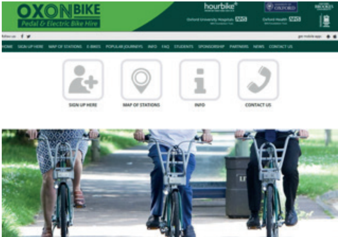
Fig.1. Sitio web de Oxonbike.