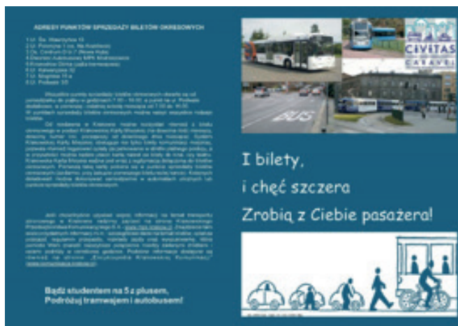
Fig. 2. Portada del folleto sobre movilidad sostenible dirigido a estudiantes de primer año.