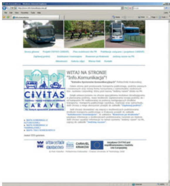
Fig. 1. Sitio web InfoKomunikacja.