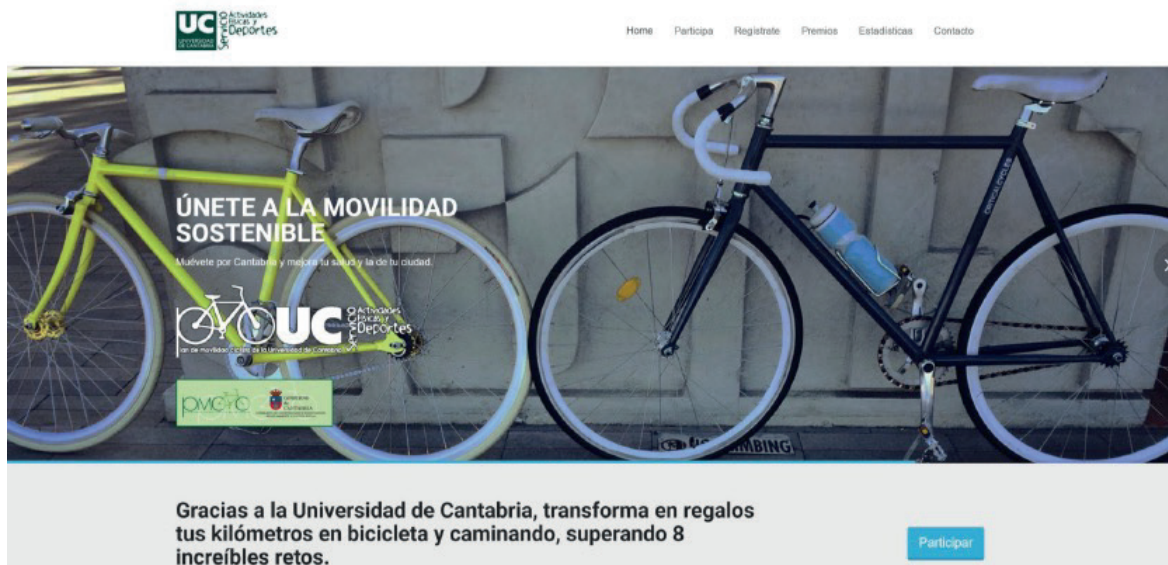
Fig 1, 2 and 3: Imágenes de la aplicación.