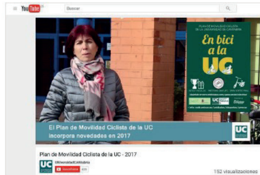
Fig 4: Los resultados de la Universidad de Cantabria