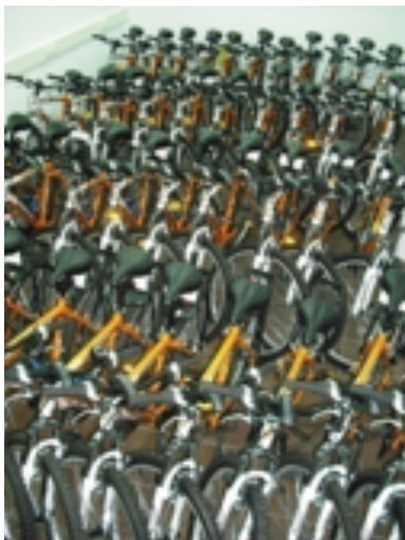
Rys. 1. Flota rowerowa i zestaw awaryjny