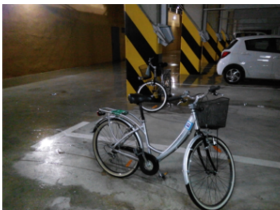
Rys. 1. Rower należący do UGr