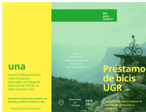
Rys. 2. Reklama systemu wypożyczalni rowerów UGr