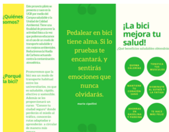
Rys. 3. Reklama systemu wypożyczalni rowerów UGr