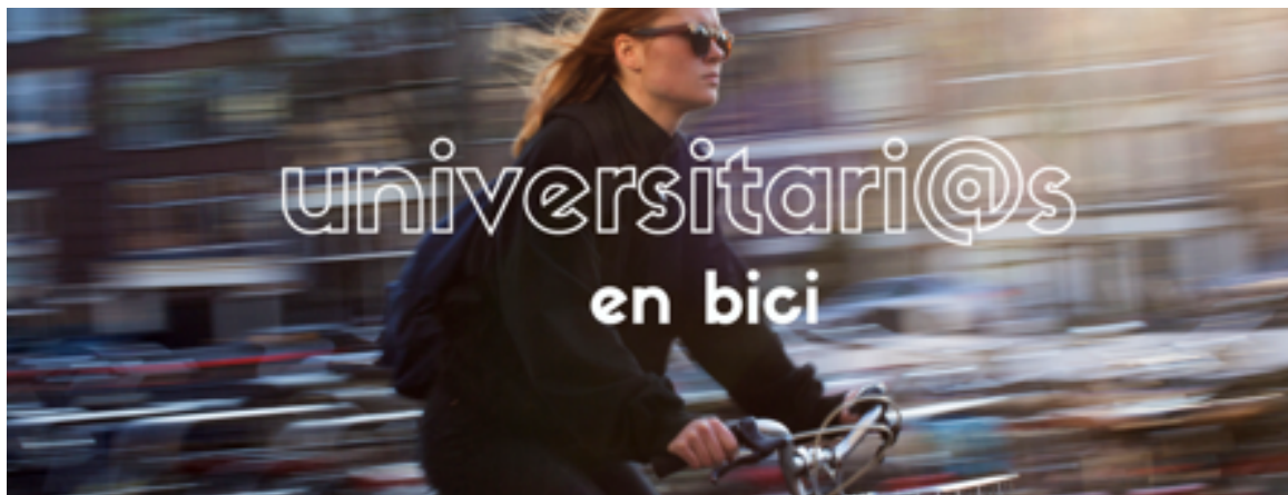
Rys. 4. Strona główna profilu na Facebooku. Studenci UGr na rowerach