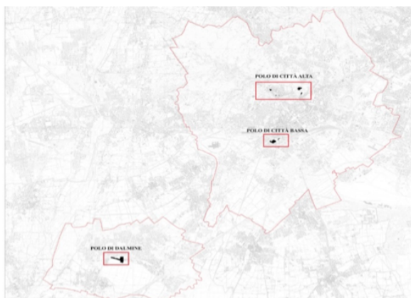
Fig. 1. Diverse sedi dell'Università degli Studi di Bergamo