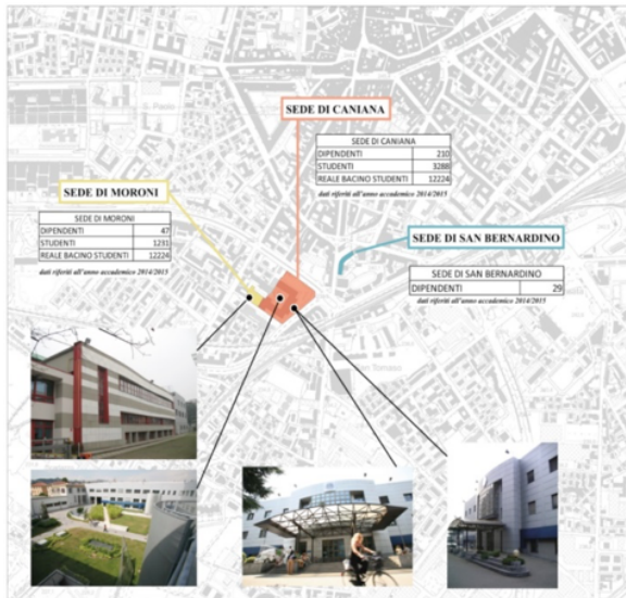
Fig. 3. Diverse sedi dell'Università degli Studi di Bergamo in Città Bassa