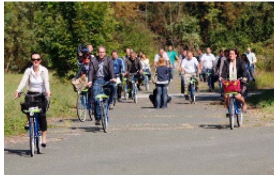
Rys. 1. Skład rowerów na kampusie Borongaj