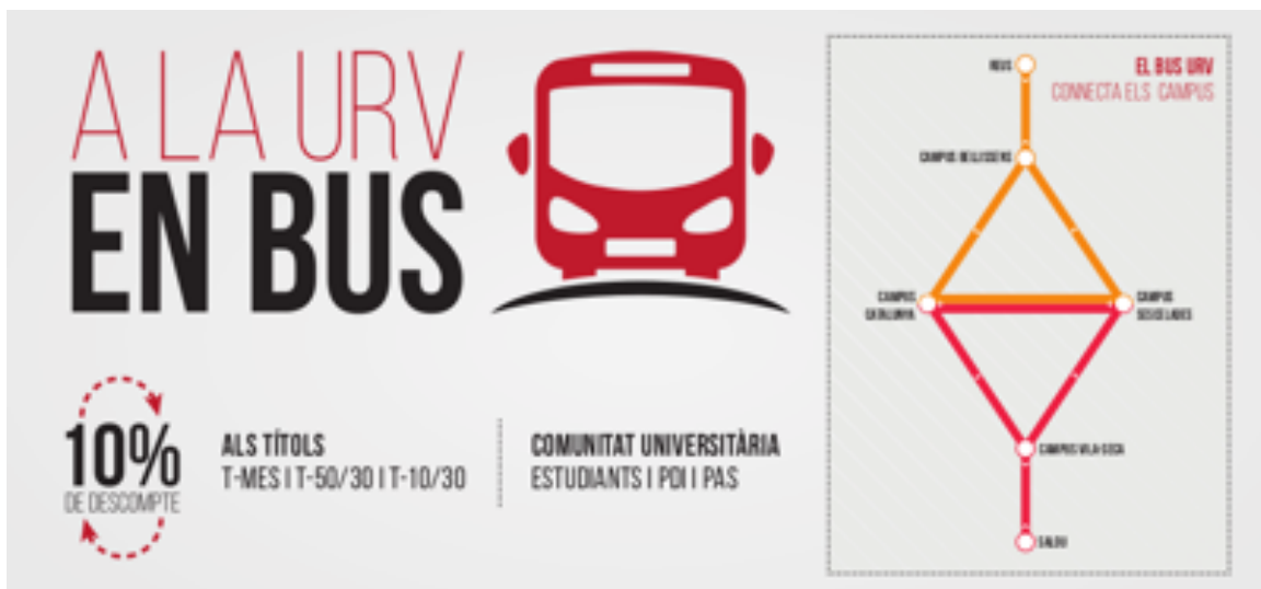
Fig 1. Promozione dello sconto