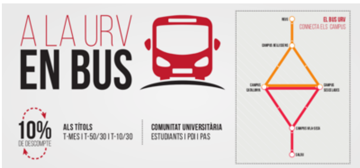
Rys. 1. Promocja zniżek