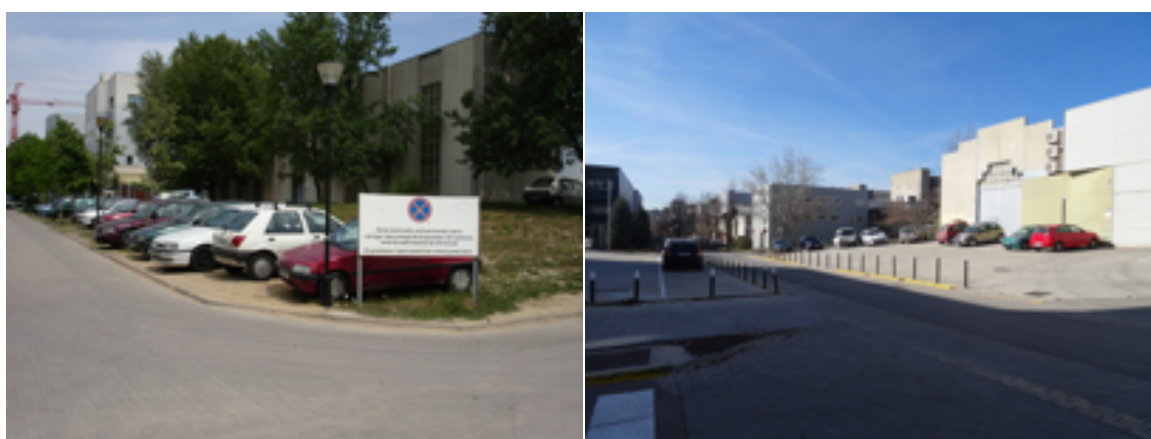
Rys. 2. Przed i po zakończeniu realizacji projektu