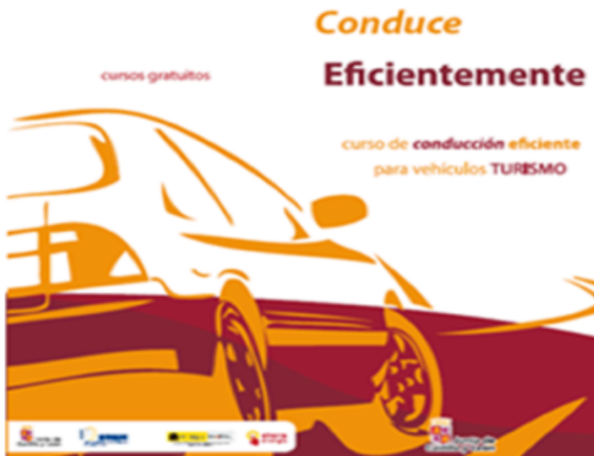
Fig. 1. Poster usato per promuovere i corsi di guida