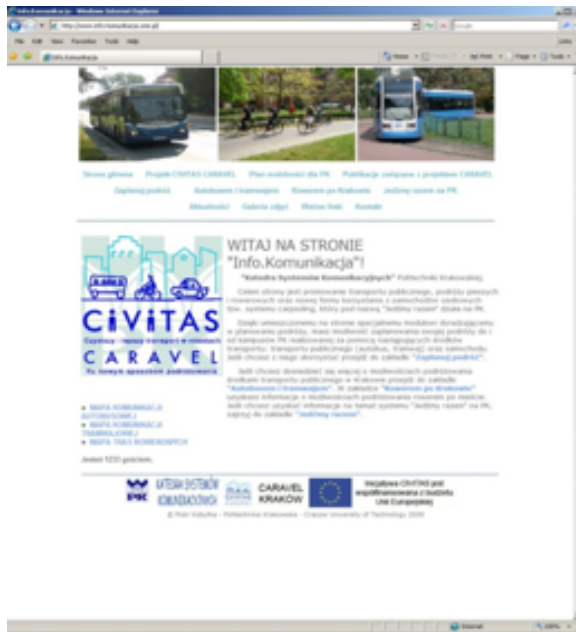
Fig. 1. InfoKomunikacja web-site