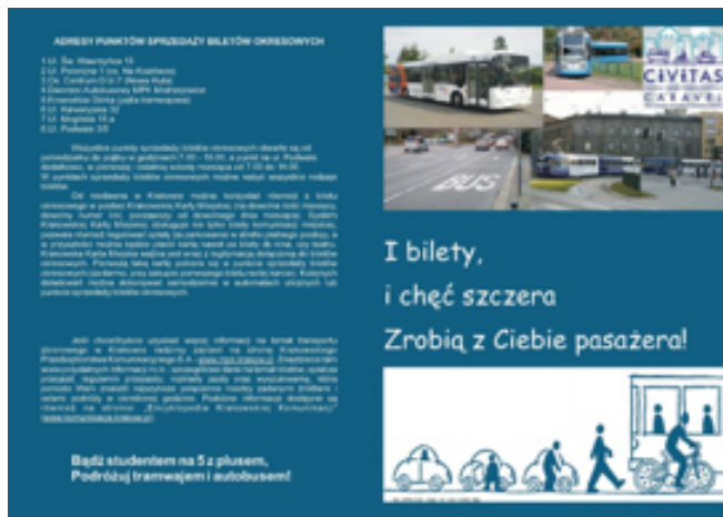
Fig. 2. Copertina della brochure sulla mobilità sostenibile destinata agli studenti del primo anno