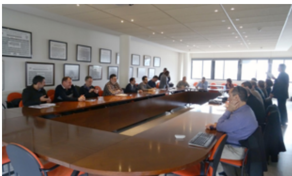
Rys. 1. Posiedzenie RADY DS. MOBILNOŚCI UAB, luty 2015