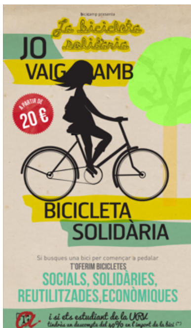
Fig 1. Poster de la campanya de difusió